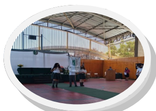
Licenciatura 4° Medio