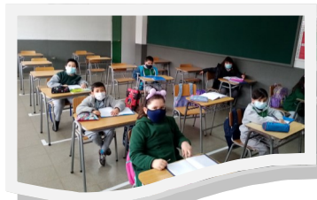
Reanudación de clases Presenciales Julio