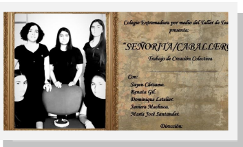
Obra de Teatro Taller de Teatro

Link Obra de Teatro https://drive.google.com/file/d/1zMFEOxyNABtmtm5QgEg0hSNppg89mvm/view?